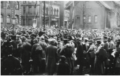
Truppenansammlung in Castrop-Rauxel, 1923

Der Vortrag beleuchtet die schwierige Lage Frankreichs in den frühen 1920er Jahren. Diese waren keineswegs nur davon geprägt, dass Frankreich seit dem Vertrag von Versailles als triumphale Siegermacht Anspruch auf eine hegemonale Politik in Europa erhob, vielmehr hatte